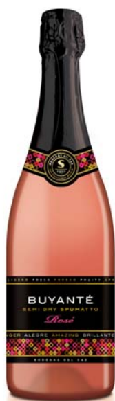
SEMI DRY SPUMATTO ROSÉ