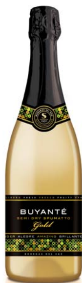
SEMI DRY SPUMATTO GOLD